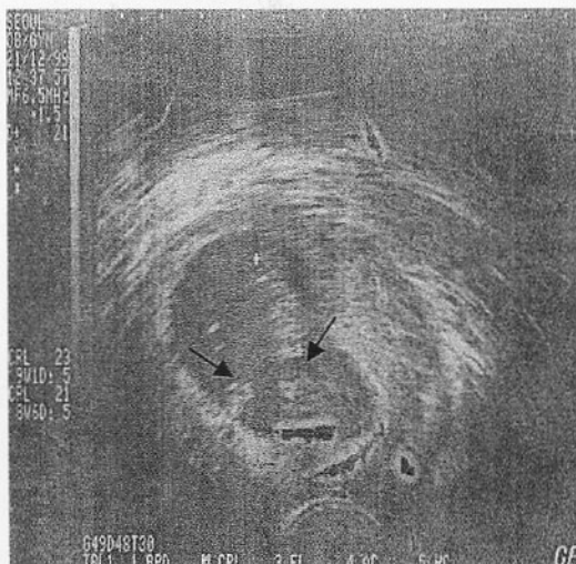
Figure 2. Two fetal heart beats are shown in one gestational sac.

유O영씨는 35세, 임신 15주 5일로 출산력은 3-1-1-0-1이고, 월경주기는 27일로 규칙적이었고, 지속일수는 3~4일, 양은 중등도 였다. 과거력상 34세 때 좌측 난관임신으로 좌측 난관절제술을 받은 병력이 있었다. 1999년 12월 17일 10개의 배란전 난포를 얻고 배아이식 5일째인 12월 22일 2개의 배반포 (blastocyst)를 배아이식하여 임신이 된 환자로 염색체 검사 및 양수 검사 위해 본원 외래로 내원해 시행한 복부초음파 검사상 양측 양수강 사이에 막은 형성되어 있지 않았고, 양 태아의 심박동은 보이지 않았으며 두정골 간격도 양측 태아에서 차이를 보이지 않았으며 양측 모두 두정